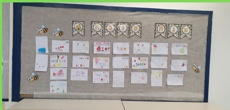
צוותא כיתות א' ו-י' קיר ברכות