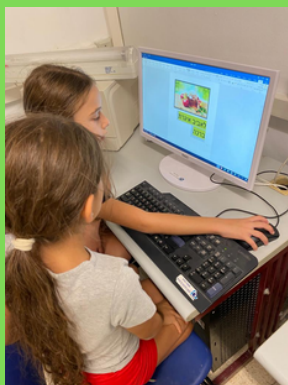
הייטק - אגרות ברכה ממוחשבות