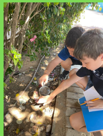
קמפוס קיימות - סיור בבית הספר, חוקרים את מאפייני הטבע העירוני