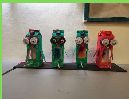
קמפוס - יצירה מחומרים ממוחזרים